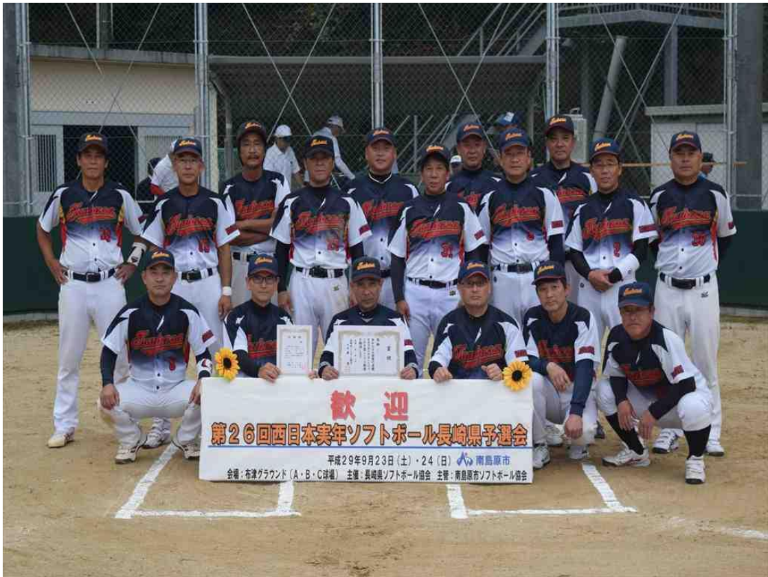
優勝 翼クラブ実年