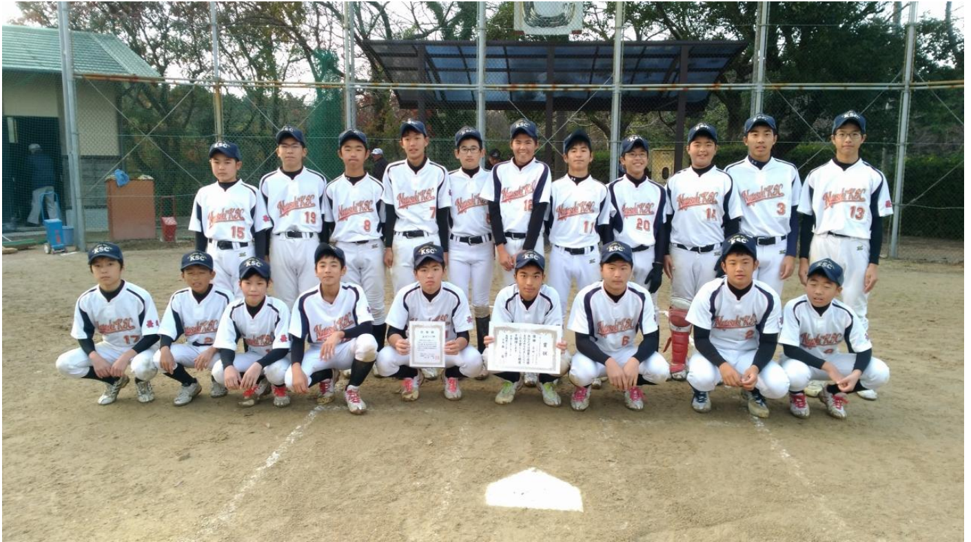
第28回 中学生選抜男子ソフトボール長崎県大会 優勝 長崎KSC