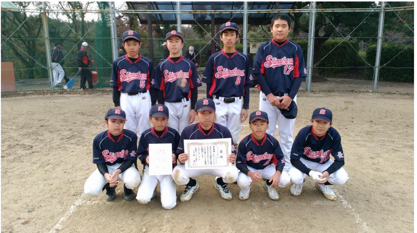
第28回 中学生選抜男子ソフトボール長崎県大会 準優勝 島原JHS男子