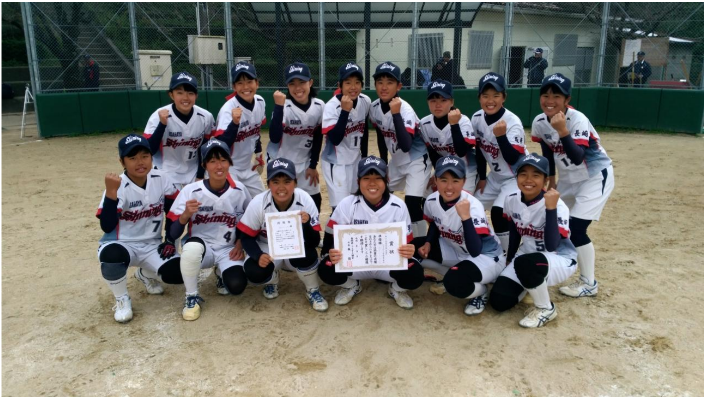
第28回 中学生選抜女子ソフトボール長崎県大会 準優勝 諫早シャイニングガールズ