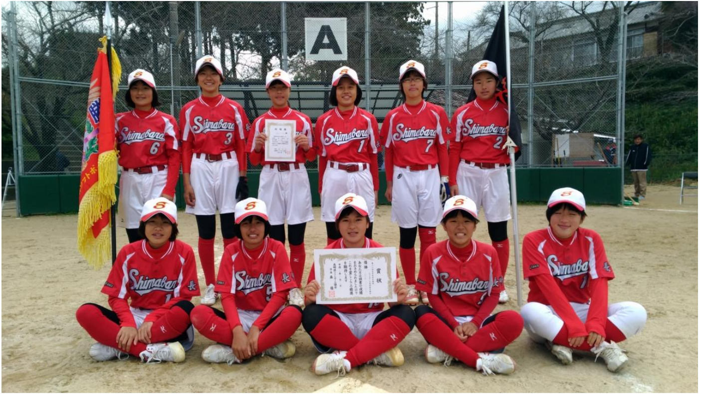
第28回 中学生選抜女子ソフトボール長崎県大会 優勝 島原JHS女子